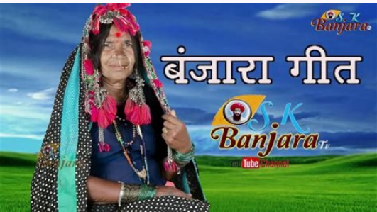
Banjara geet song video.